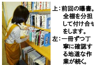
上: 前回の曝書。全棚を分担して付け合せをします。 左: 一冊ずつ丁寧に確認する地道な作業が続く。