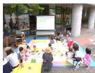
通りかかった親子連れが足を止め、参加する場面も。

毎月一回開催のちえテラスイベント。7・8月は館内を飛び出し、ちえりあ前広場を会場として実施しました。気持ちの良い天気の中、子どもから大人まで、普段とは違う屋外でのイベントを楽しむ姿が見られました。