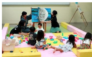
「みんなのおへや」で読み聞かせ

また、『ノスタルジックトシヨシツ』では今年初の映画上映。来館者はいつもと違う雰囲気味わいながら映画に見入っていました。