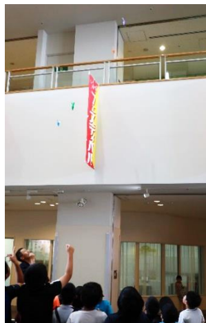
とべとべ!紙コプター滞空時間コンテスト