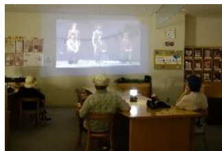
ノスタルジックトシヨシツ