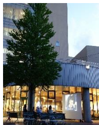
夏の夜風を受けて見る映画。室内ではまた違った趣があります。