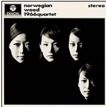
『ノルウェイの森』 (1Q24.24) 収録時間: 56 分

から一枚。見覚えのある このジャケット写真は、 クラシックをベースに洋 楽アーティストのカバー をする、女性カルテット 『1966 カルテット』のデビ ユーアルバムです。 本家とはまた違う、 女性ならではのテ イストでお楽しみ ください。