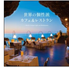
『世界の個性派カフェ & レストラン』 (673/セ) パイインターナショナル

から一冊。ここへ行ってみたい！と 思える素敵なカフェ エ&レストランの 写真集です。それ ぞれの国の文化や 伝統が感じられる 店や絶景を楽しめ る店、奇抜なインテリ アの店などを紹介して います。世界中のカフ エやレストランを訪れ た気分を味わえること 間違いなしです。