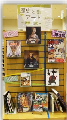
※写真は昨年ようす