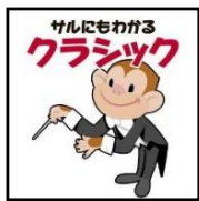
『サレにもわかるクラシック』 (1L24.54) 収録時間：60分

クラシックと聞くと、難しそう…。聴いてみたいけれど、何を選んだら良いかわからない…：そんな方にオススメ。クラシックの長い歴史を飾る、究極の名曲が揃っています。楽しく聴いて、クラシックを覚えてみませんか？TVでお馴染みの作曲家の青島広志先生が監修しています。