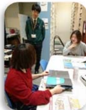
←打ち合わせのひとりのストーリーが面白い『おちんこもだち』のイラストに驚き(笑)。

2月のおはなし会では、絵がきれいな大きい絵本や、かわいいねこが主人公のお話しを読みました。今月はどんな絵本が登場するのか、ただいま選んでいるところですので、お楽しみに。おはなし会は事前のご予約は不要で、ちえテラスのおはなし会の会場に直接お越しください。