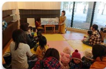
↑「あったとさ、あったとさ・・・」言葉のリズムが楽しい絵本『きよだいな きよだいな』を読み聞かせ。

メディアプラザでは月に1回ちえりあ内のちえテラス(タリーズコーナー)でおはなし会を開いています。大人も思わず考えさせられるような絵本や、ことばあそびを楽しむことのできる絵本などを、読み手である担当の司書が毎回選んでいます。事前に読む練習をしていると、その場が小さなおはなし会のようになることもしばしばあります。