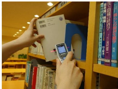
↑メディアプラザの全ての資料を専用の機械で読み込んでいきます。

5月25日から31日まで蔵書点検のため、1週間休館をいただきました。いつもメディアプラザをご利用いただいているみなさまには大変ご不便をおかけいたしました。蔵書点検期間に行うことは本やCDの所蔵確認のみならず、普段動かすことのできない部分の清掃や、インターネットコーナーのパソコンの調整など、みなさまにより快適に過ごしていただけるよう毎年行っています。