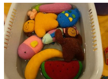
↑おはなし会で子どもたちに遊んでもらうぬいぐるみもきれいに洗浄しました。

5月25日から31日まで蔵書点検のため、1週間休館をいただきました。いつもメディアプラザをご利用いただいているみなさまには大変ご不便をおかけいたしました。蔵書点検期間に行うことは本やCDの所蔵確認のみならず、普段動かすことのできない部分の清掃や、インターネットコーナーのパソコンの調整など、みなさまにより快適に過ごしていただけるよう毎年行っています。