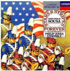
『屋敷旗よ永遠なれ スーザ・マーチ集』 (1N1.11) 収録時間: 41分

数多くの行進曲を作曲し、アメリカのマーチ王と呼ばれたジョン・ファイリツプ・スーザの代表曲を集めたCDです。躍動感あふれるマーチの名曲をお楽しみください。