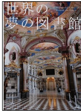
『世界の夢の図書館』 エクスナレッジ/出版 (010/セ)

豪華絢爛な世界遺産から先進的な現代建築まで、厳選された世界最高峰の図書館37館を、美しい写真とともに紹介しています。おおきい本だから迫力が違います！