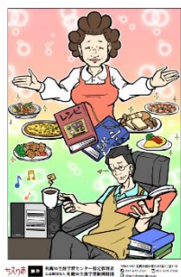
↑前号(第5号)の表紙。第6号ははたしてどんな表紙になるでしょうか。