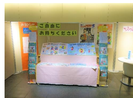
↑前回の配布会の様子。今回も学習相談ブースを設けて相談を受け付ける予定です。

年に2回、夏と冬に発行しているさつぽろ生涯学習情報、「おとなの学び場MAP」の第6号がいよいよ発行されます。 前号からスタートした特集ページですが、今回は見開き1ページにポリウムアップし、「ちえりあ市民講師バンク」について詳しく記載しております。 「おとなの学び場MAP」第6号は2月中旬発行予定です。お楽しみに！