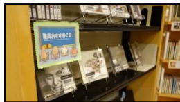
↑おすすめCDは 新着CD棚正面の下段

本やCDを借りてみたいけれど、どのようなものがよいかと迷ったときには、ぜひ職員おすすめを参考にしてみてください。