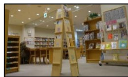
↑おすすめ図書は 中央のブックタワー