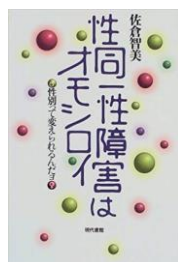
『性同一性障害はオモシロイ性差別って変えられるんだヨ』 佐倉 智美/著 (367#)

今から20年以上前の1999年に発行されたこの本。「性同一性障害」という言葉自体が目新しい時代。そんな時代の体験をユーモラスな文で綴る。時代の変化が分かるよう、最新の本も揃えてお待ちしております。