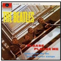
『プリーズ・プリーズ・ミー』 (1N2.6) 収録時間: 33分

今年はジョン・レノン生誕80年、没後40年にあたります。こちらの作品は、レコーディングをたった1日で終了させたといわれている、記念すべきビートルズのファースト・アルバム。ファンでなくとも必聴の一枚です。