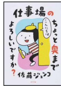
『職場のちょっとした奥までよろしいですか?』 佐藤 ジュンコ /著(366/サ)

世の中には様々なお仕事がありますが、こちらの図書は「つくる」仕事のプロに筆者が取材を行ったルポとなつています。イラストで取材の様子が描かれているので、親しみやすい内容となっております。