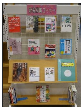
↑ 新作図書コーナーです。緑色のファイルに新着本リストがはさめてあります。

また、新着として表出しされた図書は、月ごとにリスト化されています。そのリストを挟んだファイルも新着コーナーに置いてありますので、何月にどんな本が新着として入れられたのかを確認することもできます。ぜひ、ご利用ください。