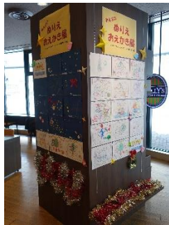
↑12月のテーマ『クリスマス』の展示の様子です。