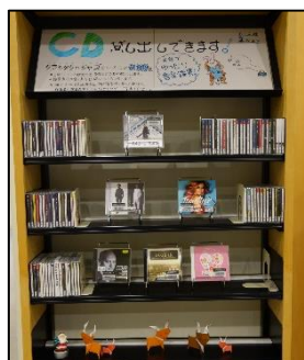
↑ 新作CDコーナーです。季節に合わせて装飾することがあります。

人気の図書だと新作コーナーに置く前に予約に回ってしまうこともあるので、新作コーナーに置かれることがないまま3カ月以上経過し、予約が落ち着いた頃に通常の書棚へ配架されるといったこともよくあります。 新作のリストには載っていないけれど、新作コーナーに置いていない本があった際には、カウンター横の検索機、もしくはカウンターにてその本が貸出中なのか予約が入っているのか、といった状況を調べることもできます。