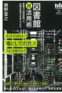
『図書館「超」活用術』奥野宣之／著 (015/才)

使っているもの、食べているもの、取り組んでいることをもつと効率的に、便利に、お得にしませんか？ さまざまな分野の活用術を集めました。本書は図書館の活用術になります。図書館の良さを再発見して、学びに役立つ一冊です。