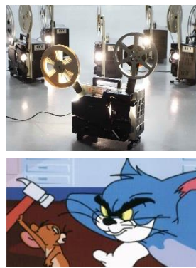
上:フィルム映写機 下:トムとジェリー

夏休み親子向けイベント!盛り沢山の7月の夏休みに入ると親子で参加できる体験イベントが盛り沢山です。 「親子で体験!フィルム映写機を君の手で操作してみよう」7月30日(日)。小学4年生から6年生と保護者と対象に、昔は小学校にあったアナログな映写機とフィルム映像を操作できる体験会です。