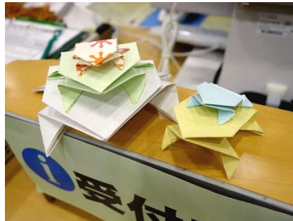
メディアプラザのカウンター付近に生息する、ぴよんぴよんがえるたち。折るのは簡単そうに見えますが、意外と難しいんです。

公共施設や文化施設・民間施設を夜間開放して、市民の皆さんと一緒に地域の文化を楽しむ行事「カルチャーナイト」。札幌市全域で行われているイベントで、今年で15年目になるそうです。毎年ちえりあも参加しており、当日の夜は子どもから大人までたくさんの方が訪れ、お祭りのようにとても賑やかです。