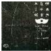
『世界民族音楽大集成1 日本の古典音楽』 (1G12.1) 収録時間: 47分

お正月といえば和楽器での雅な音色が響きます。そこで今一度、日本の古典音楽を聴いてみませんか。雅楽は「世界最古のオーケストラ」と呼ばれ、無形文化遺産にも登録されるなど世界からも評価の高い文化です。歌舞伎や能楽などもあるわけて、和の響きをどうぞ。