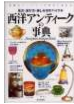
『西洋アンティークの事典』 成美堂出版編集部/著 (756/セ)

『和のアンティーク事典(756/W)』とセットの本となつているので、そろそろ一緒にいかがでしょうか？