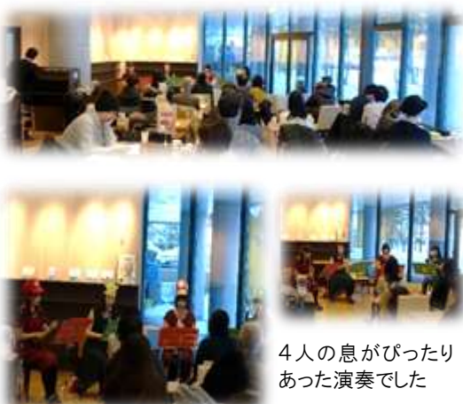
4人の息がぴったりあった演奏でした

毎月行われるおはなし会に加え、様々なイベントを行うちえテラスに今後も期待していきたいです。この場を借りて、支えてくださっている皆様に心より感謝申し上げます。