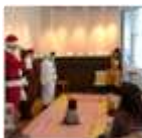
このころ温まる光景でした。

流し、20日に行われたおはなし会では、サンタさんが登場しました!! プレゼントを配る素敵なサプライズに子ども達は大はしゃぎ! 雪も溶かすような