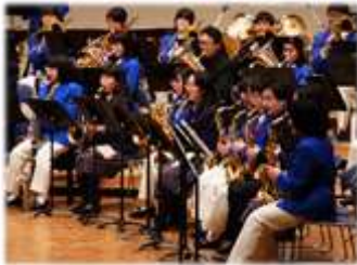
写真は昨年の様子