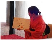
物でとれ は外せら は屋かじ は夏かじ 始めは 年姿、読 の読みを 季、工夫 の季節も

珈琲の香りが漂い、素敵なBGMが流れる「ちえテラス」。もつと気軽に生涯学習を感じられる場所を…との思いから生まれたこの新しいスペースで、この1年さまざま催しを行いました。中でもすっかり定着したのが、メディアプラザ職員による絵本や紙芝居の「おはなし会」。毎月、近隣の親子連れや保育園児が訪れ、ちえテラスにかわいい笑顔の花が咲いています。