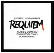
『A ロイド・ウェッバー レクイエム』 (1Q1.51) 収録時間: 45分

お薦めは、ミュージカル音楽で大成功を収めた作曲家ロイド・ウェッバーのレクイエム。美しいメロディーとレクイエム概念を覆すダイナミックなオーケストラをご堪能ください。