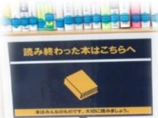
↑読み終わった本を置く場所が増えました。

メディアプラザの中にある表示が新しくなったり、増えたりしています。これからも変わっていきますので探してみてくださいね♪