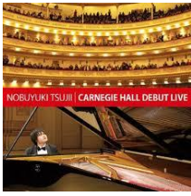
『辻井伸行 カーネギーホール・デビュー』 (P24. 1.) 78分

盲目のピアニスト、辻井さんの初のカーネギーホールライブ。ベートーヴェンの《テンペスト》や、3・11の犠牲者に捧げた自作曲「それでも、生きてゆく」が収録されています。満席の会場を感動に包み込んだ音色をご堪能ください。