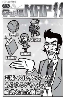
↑目印の表紙です。手に取りやすいサイズになっています。

ちえりあ館内だけでなく各図書館、地区センターや区民センターなど、市内の公共施設で広く配布しておりますので、見かけたらぜひ手に取ってお持ち帰りください。