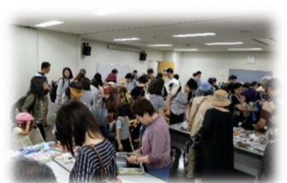
↑ 3年前の保存期間終了雑誌無料プレゼントも賑やかでした。

んの内容です。リサイクルプラザ宮の沢では「530(ごみゼロ)フェア」を開催。宮の沢若者活動センターではちえりあ前広場にキッチンカーが登場して、ワッフルの販売を行います。今年「西区こども環境広場」も同時開催し、「ステージイベントや実験ブースなどで楽しみな環境について学べます。子どもから大人まで楽しめるさまざまなイベントを予定していますので、たくさんの方のお越しをお待ちしています。