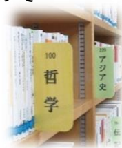
↑表示が新しくなり、本が探しやすくなりました。