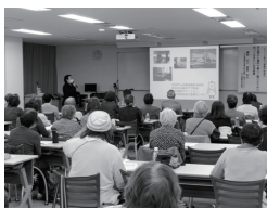
11 北海道医療大学 公開講座