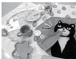
23 札幌芸術の森 ふらっとクラフト体験