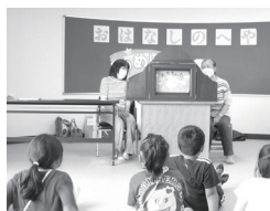
35 西岡図書館 たのしいおはなしの会