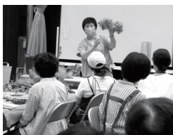
26 百合が原公園 講習会