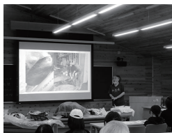
18 学校法人酪農学園 野生動物獣医学が目指すもの