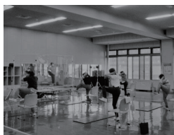
28 東健康づくりセンター 初めての筋活教室