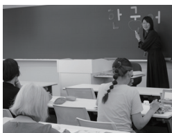
10 北星学園大学 ハンゲル入門講座