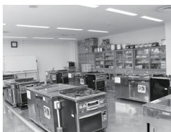
29 北区民センター グルテンフリーパン講座