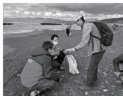
21 北海道博物館 “海岸漂着物”への取り組み