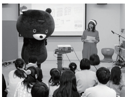
33 えほん図書館 図書館デビュー