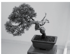
25 豊平公園 秋の盆栽管理講習会