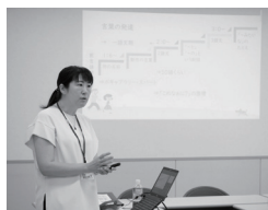
16 星槎道都大学 公開講座