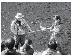
20 豊平川さざき科学館 琴似発寒川サケ観察会