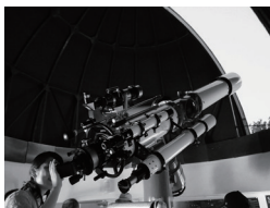
19 札幌市青少年科学館 天文台夜間公開