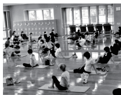
27 西健康づくりセンター ゆるゆる健康体操