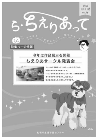
ら・ちえりあって